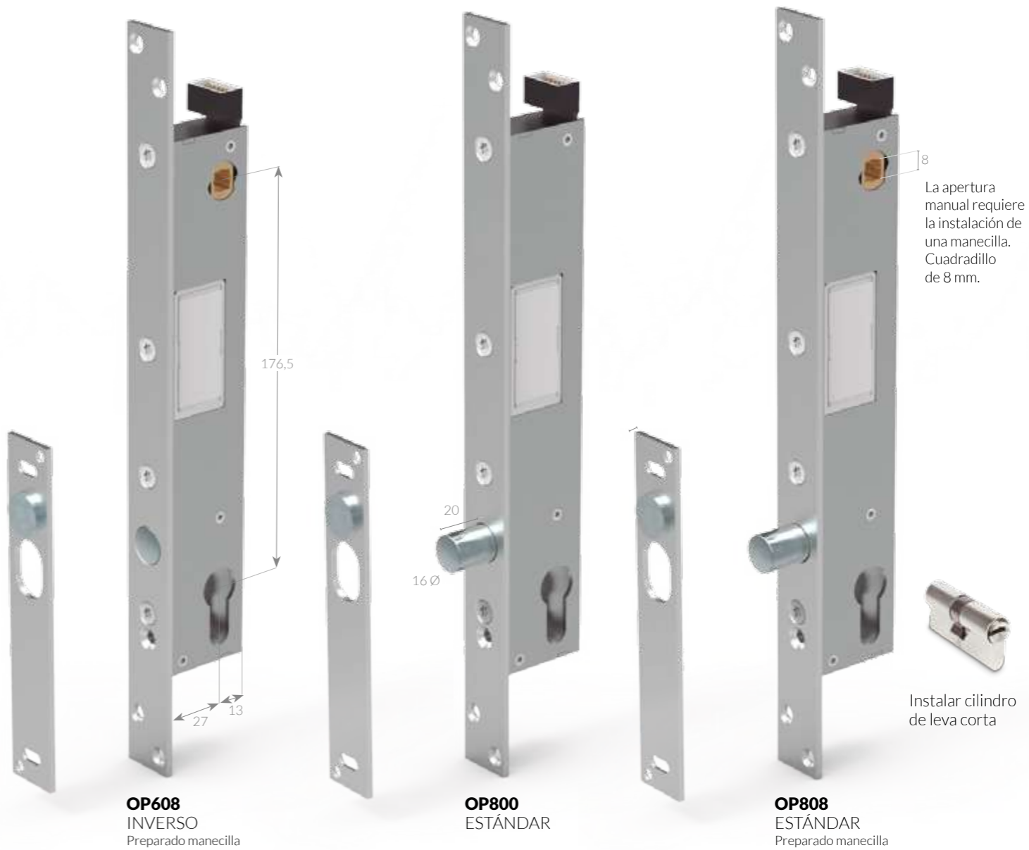
OP808 INVERSO Preparado manecilla