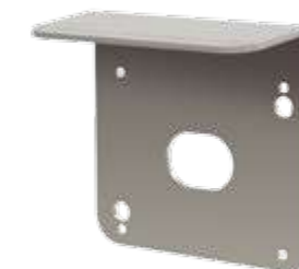
VCX100 (Opcional) Visera de acero cubre cerradura. Protector de lluvia para exteriores