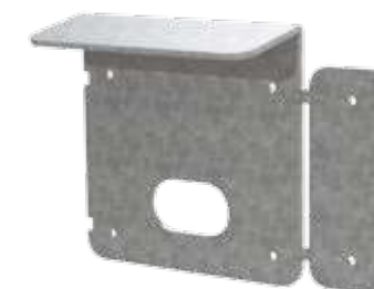
VCX200 (Opcional) Visera de acero cubre cerradura. Protector de lluvia para exteriores