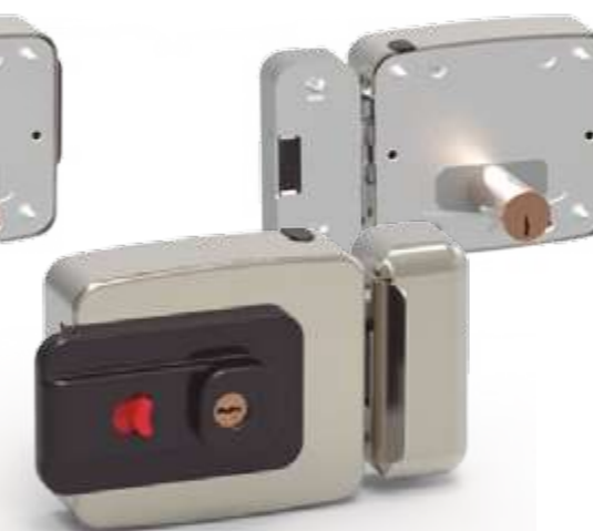
CE112 Con llave y pulsador mecánico