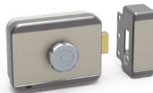
CE106 Con pomo