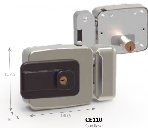
CE110 Con llave