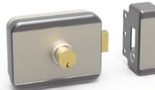
CE109 Con llave (cilindro)