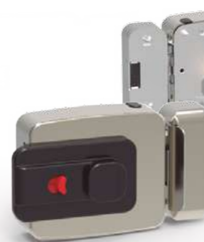
CE111 Con pulsador mecánico